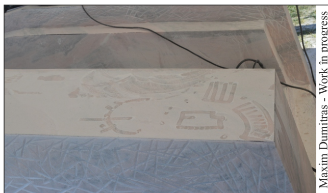
Maxim Dumitraș - Work in progress