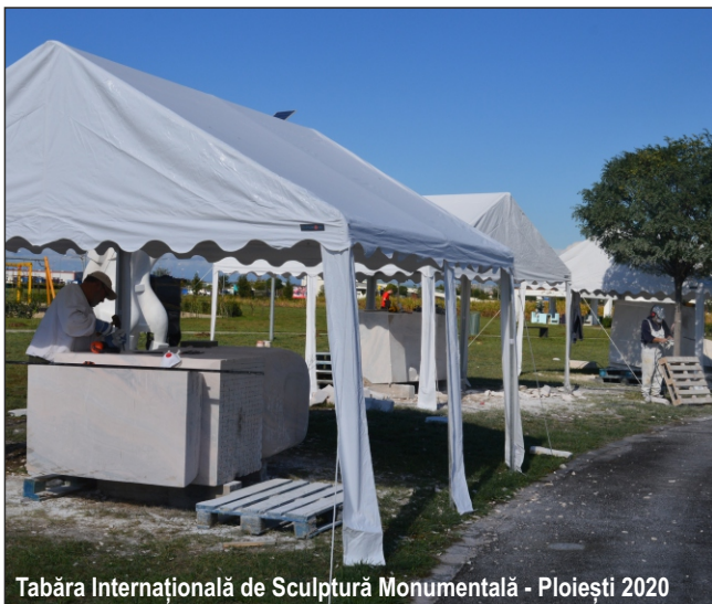
Tabăra Internațională de Sculptură Monumentală - Ploiești 2020

Reputatul istoric Gheorghe Brătianu își termină conferința, un model de erudiție istorică, prin cuvintele lui Clemenceau care a spus: „Franța a fost ieri soldatul lui Dumnezeu, azi e soldatul libertății și întotdeauna va fi generoasă și idealistă”.