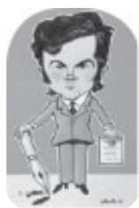
autorul văzut de Alexandru Clenciu