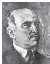
Portret de Marius Bunescu