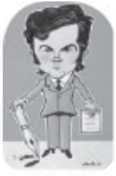
autorul văzut de Alexandru Clenciu