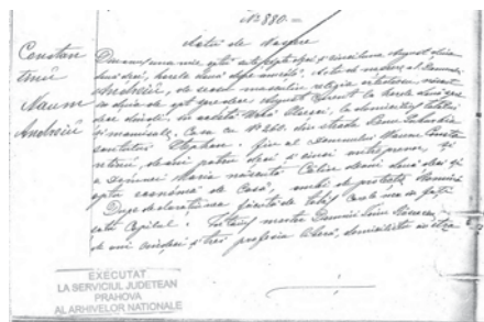
Fig. 1 a

În [1] este precizată data nașterii lui Andrei Naum, 18 august 1875, dar în București și nu în Ploiești, cum se putea presupune datorită absolvirii Liceului „Sfinții Petru și Pavel” din Ploiești.