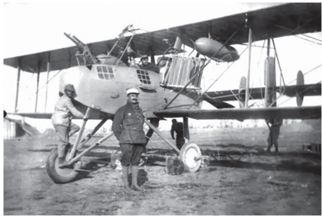
Avion de bombardament „Breguet V” (colecția Valeriu Avram) ( http://amnr.defense.ro/app/webroot/fileslib/upload/files/Revista_Document/Revista_067_2015.pdf )